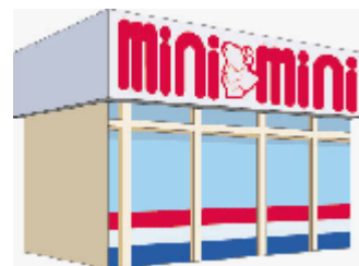
ミニミニ店内や受付台上などに告知ツールを展開