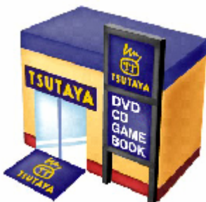
TSUTAYA店頭でポスターを展開